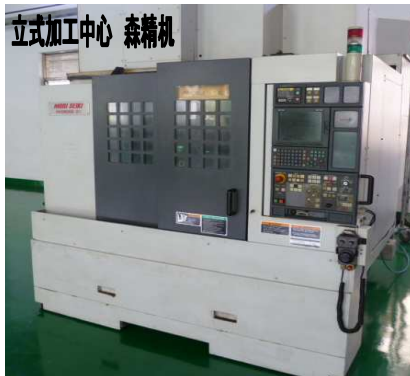
立式加工中心 森精机