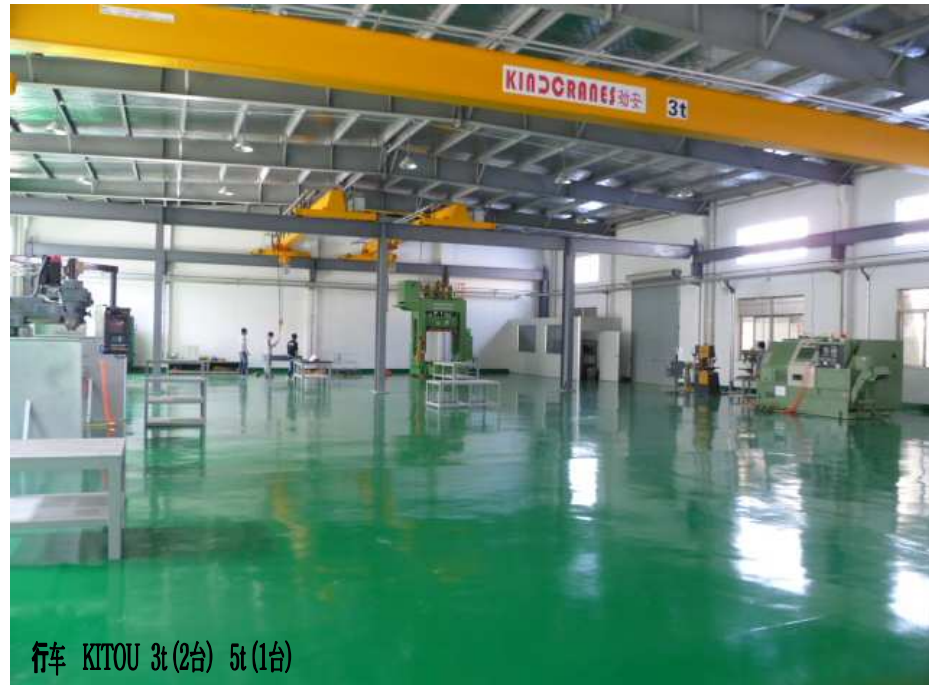
行车 KITOU 3t (2台) 5t (1台)