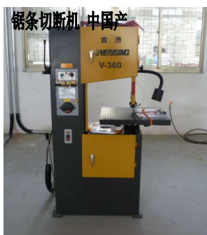
锯条切断机 中国产